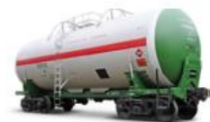
Динаміка змін вагонів протягом років