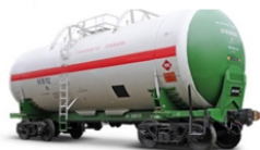
Динаміка змін вагонів протягом років